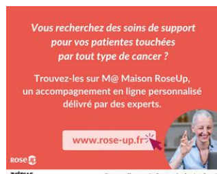
3 MÉDIAS ENGAGÉS Espace offert par le Groupe Profession Santé