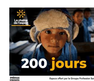
3 MÉDIAS ENGAGÉS Espace offert par le Groupe Profession Santé