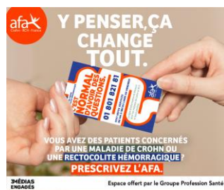
3 MÉDIAS ENGAGÉS Espace offert par le Groupe Profession Santé