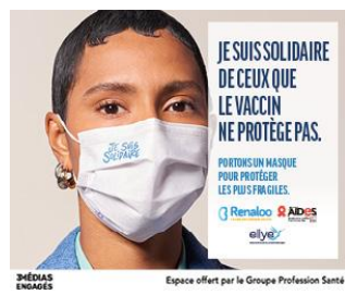
3 MÉDIAS ENGAGÉS Espace offert par le Groupe Profession Santé