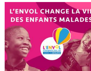
3 MÉDIAS ENGAGÉS Espace offert par le Groupe Profession Santé