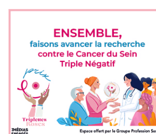
3 MÉDIAS ENGAGÉS Espace offert par le Groupe Profession Santé