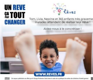
3 MÉDIAS ENGAGÉS Espace offert par le Groupe Profession Santé