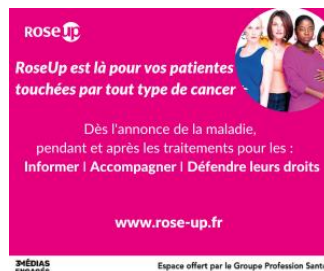
3 MÉDIAS ENGAGÉS Espace offert par le Groupe Profession Santé