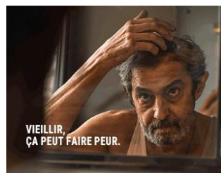
3 MÉDIAS ENGAGÉS Espace offert par le Groupe Profession Santé