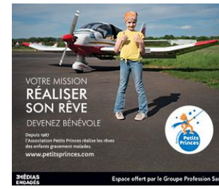
3 MÉDIAS ENGAGÉS Espace offert par le Groupe Profession Santé