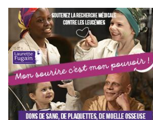
3 MÉDIAS ENGAGÉS Espace offert par le Groupe Profession Santé