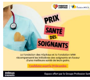
3 MÉDIAS ENGAGÉS Espace offert par le Groupe Profession Santé