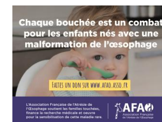
3 MÉDIAS ENGAGÉS Espace offert par le Groupe Profession Santé