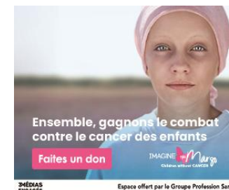
3 MÉDIAS ENGAGÉS Espace offert par le Groupe Profession Santé